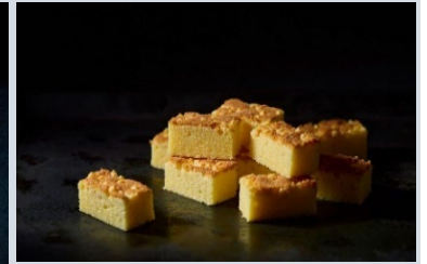
SNOW WHITE CHEESE